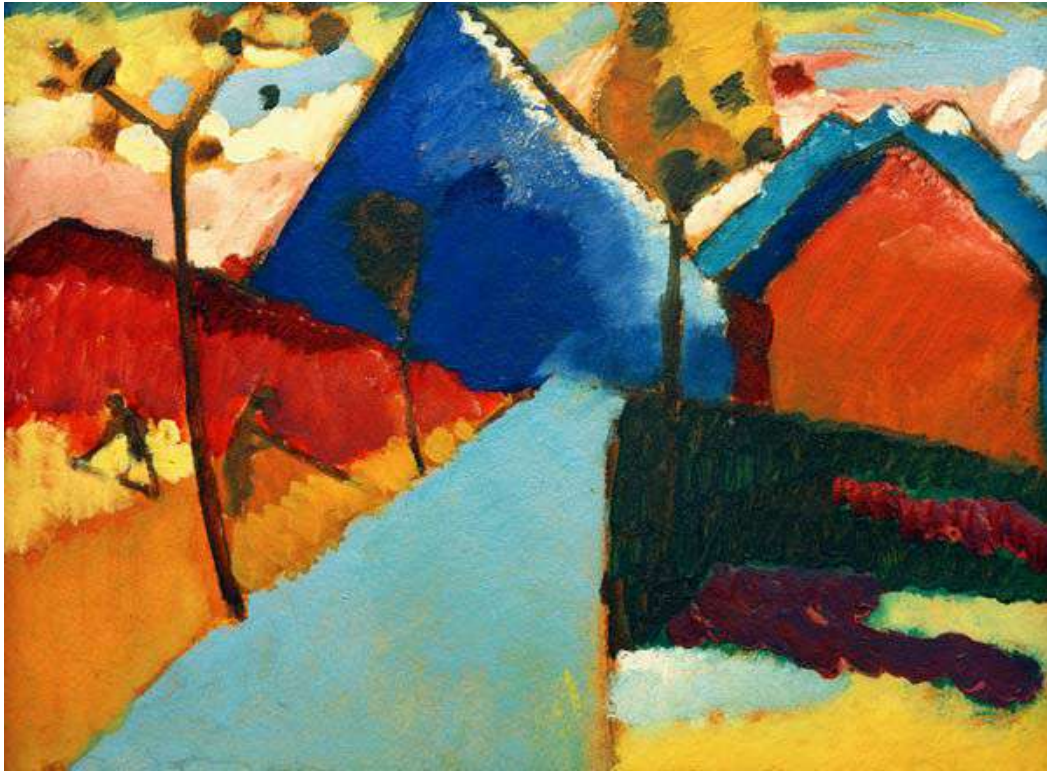
Toiles de Kandinsky